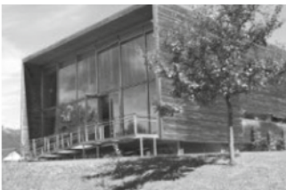
Hittisau, Kultur- und Feuerwehrhaus