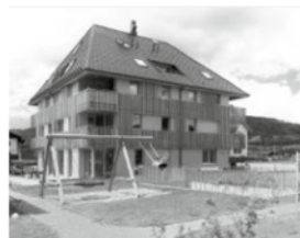
Andelsbuch, Miteinander Füreinander Sozialhaus