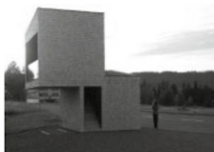
Krumbach, BUSSTOP Krumbach Moos